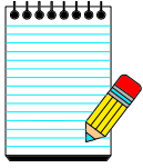
TABELA INSS - EMPREGADOS - SALÁRIO-FAMÍLIA BENEFÍCIOS - REAJUSTE A PARTIR 02/2009

A Portaria Interministerial nº 48, de 12/02/09, DOU de 13/02/09, do Ministério da Previdência Social e do Ministério da Fazenda, dispôs sobre o reajuste dos benefícios pagos pelo Instituto Nacional do Seguro Social - INSS e dos demais valores constantes do Regulamento da Previdência Social. Na íntegra: