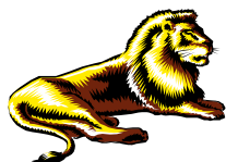
TABELA DO IRRF - JANEIRO/2005 ALTERAÇÃO

A Medida Provisória nº 232, de 30/12/04, DOU de 30/12/04, edição extra, alterou a Legislação Tributária Federal, inclusive a tabela do IRRF a partir de janeiro/2005. Na íntegra: